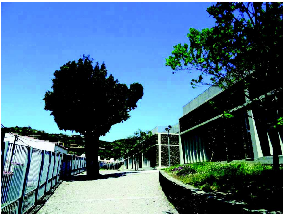
Escoles, maig de 2015.