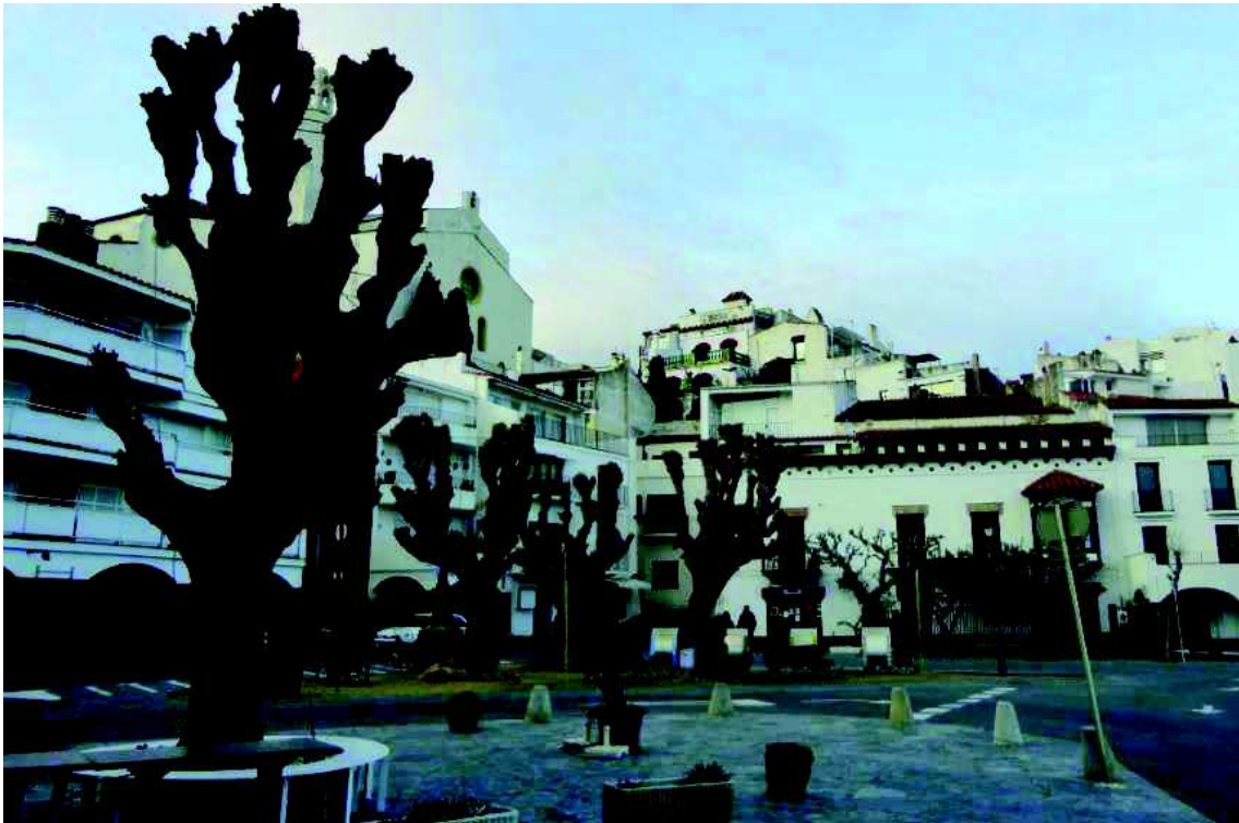
Plaça del Doctor Pons febrer i maig de 2015.