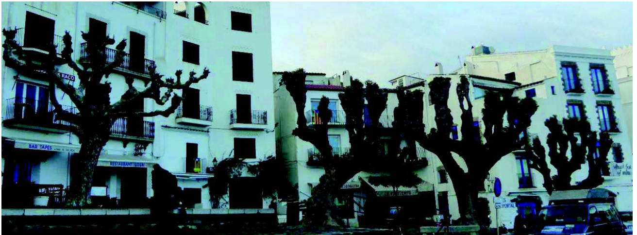
Imatges del febrer i maig de 2015, Plaça del Doctor Trèmols.