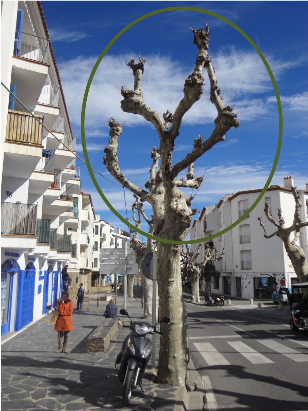
Capçada amb poda de brocada.