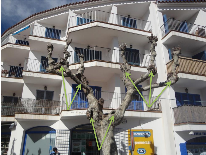
Capçada amb estructura brocada i punts problemàtics amb xancre.