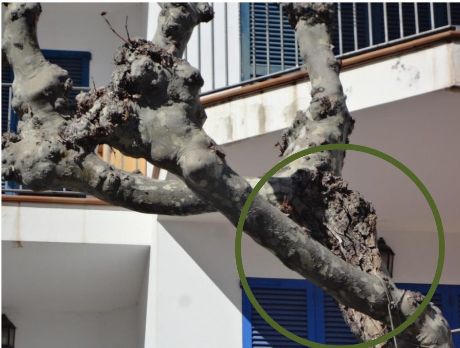
Xancre molt problemàtic. Cal eliminar la besa per pes excessiu Amb risc de trencament